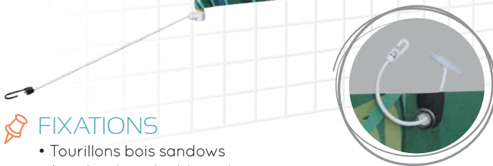
OEILLET + SANDOW À BASCULE