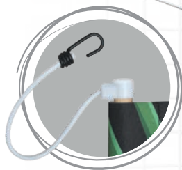
TOURILLON BOIS SANDOW